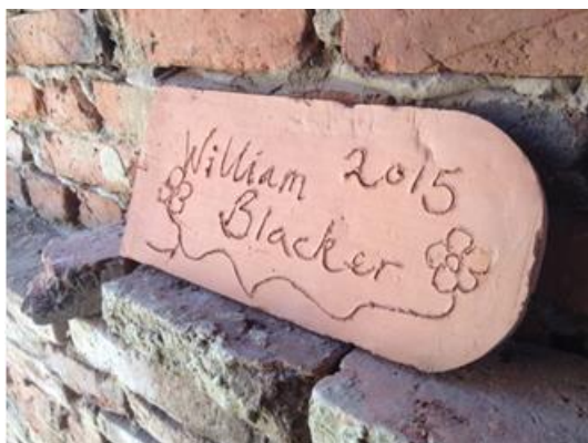
Namen eines Spenders