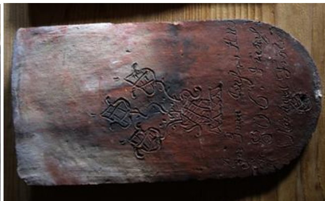
Inskript einer Historischen Dachziegel mit Namen des Hausherrn, Jahr 1806