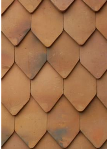
Neue traditionell gebrannte Dachziegeln