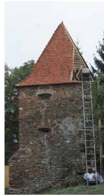
Arbeit am Speckturm, 2013