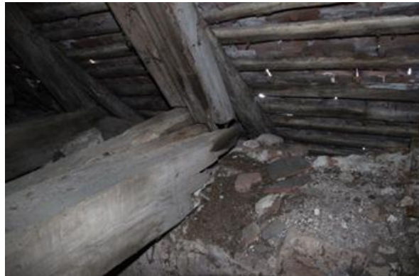
Verrotetes Dachholz am Hauptschiff: viele der Holzverbindungen sind betroffen, 2016