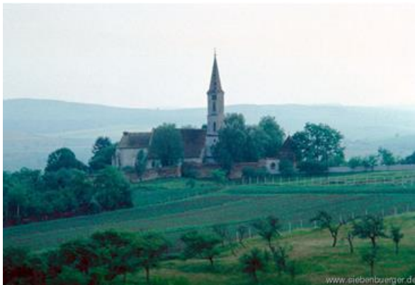
Ansicht Kirchenburg, Nordseite

Nun muss das Kirchendach dringend repariert werden. Der Dachstuhl ist an mehreren Stellen einsturzgefährdet. Wasser und Schneewasser sickert durch. Dank der Kirchenburgen, auch der von Alzen, dank der gesamten einmaligen schönen Landschaft und des traditionsbewussten Lebens der Bewohner dieser Dörfer, wurde Siebenbürgen von einer der wichtigsten Tourismusorganisation weltweit der I Platz für 2016 einberäumt. Gleichzeitig wird Siebenbürgen als die größte öco-touristische Region Europas beginnend mit 2017 gelten. Dass gibt uns eine große Ehre, verpflichtet uns aber gleichzeitig unser Kulturgüter zu retten. Vorläufig haben wir Unterstützung mit Eugen Vaida in dem Entwurf des Restaurierungsprojektes gefunden.