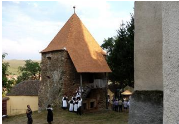
Restaurierung des Speckturms mit handgemachten Ziegeln