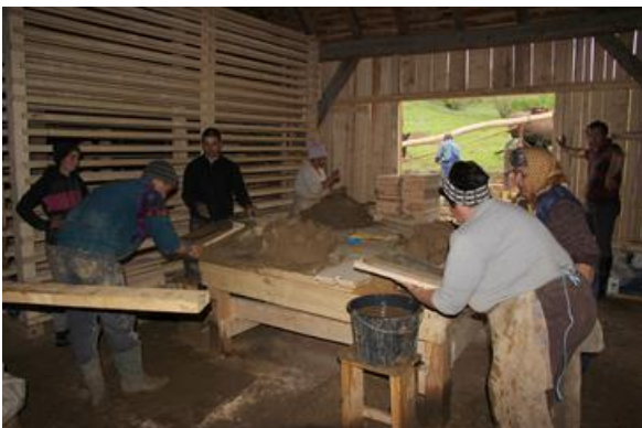
An der Arbeit