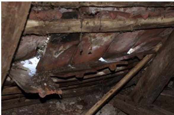
Verfall der Dachdeckung am Hauptschiff, 2016